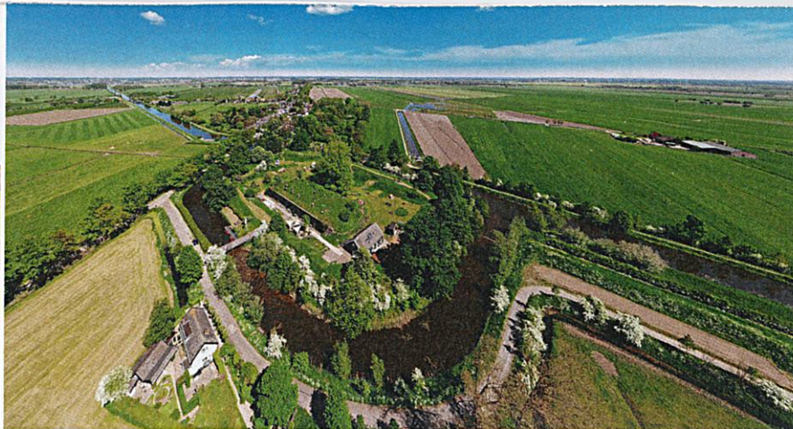
Dankzij de waterlinie met onder meer Fort Werk aan de Korte Uitweg is het Eiland van Schalkwijk nog zo groen.